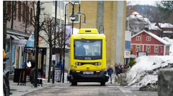
Autonomous bus in route through Kongsberg streets in mixed traffic

Разгледаният проект надминава по своята иновативност повечето проекти за внедряване на обществен транспорт при поискване, предвид факта, че той предвижда изпълнението на транспортната услуга да бъде от автоматизирани превозни средства, които не се управляват от оператор. В превозното средство има единствено помощен персонал, който съдейства на пътниците и ползвателите при необходимост.